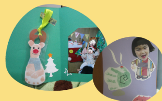
毎月変わる親子クラフト