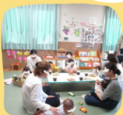
ほっとひと息ティータイム♪