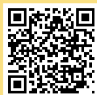
予定表（ホームページ）