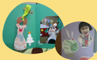
毎月変わる親子クラフト