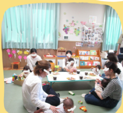
ほっとひと息ティータイム♪