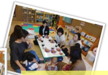
“ホッ”とひと息 ティータイム