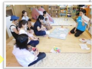
“ホッ”とひと息 ティータイム