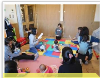
本園主幹保育教諭 による子育ての話も♪ (年4回)